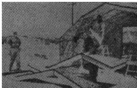
原图说明：轻便易搭的掩蔽所